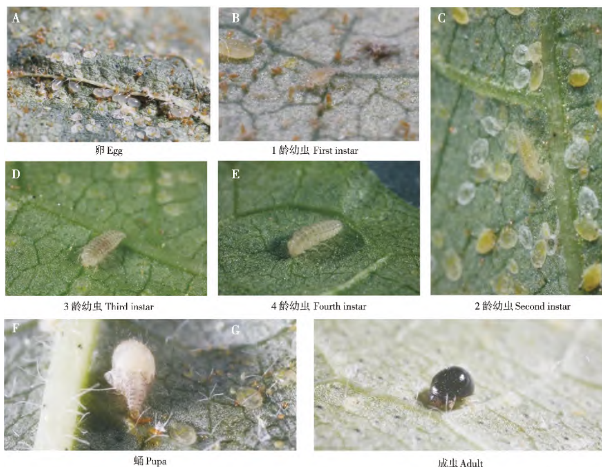
图1 沙巴拟刀角瓢虫各虫态照片